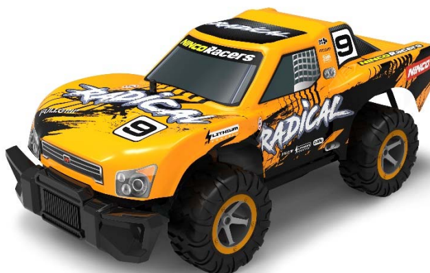
NH93161 NINCORACERS RADICAL

We hereby declare, under our sole responsibility, the conformity of following products